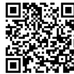
游於藝網站使用說明影片